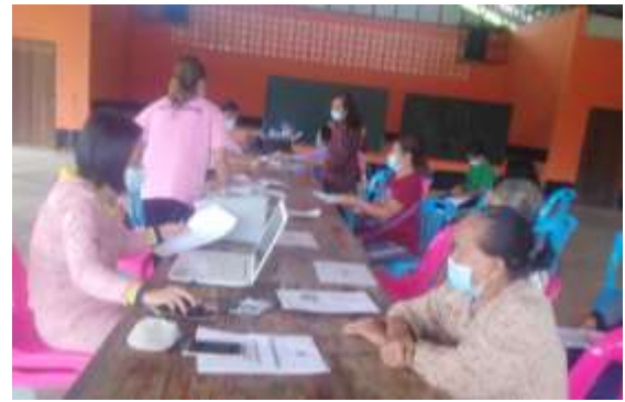
กิจกรรม"หน้าบ้าน นำมอง"