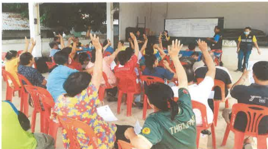
โครงการฝึกอบรมจริยธรรมสำหรับพนักงานส่วนตำบล คณะผู้บริหาร และสมาชิกสภา อบต.